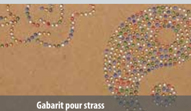
Gabarit pour strass