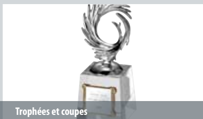
Trophées et coupes