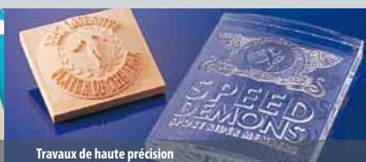
Travaux de haute précision